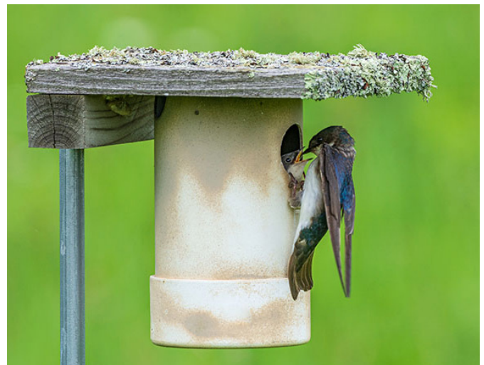
It is easy to attract and monitor birds with a Gilbertson PVC nest box.

Nesting boxes come in a variety of shapes and sizes designed to make the perfect home for many different species.