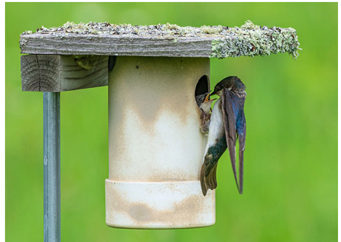
Casa para pájaros hecha con tubería PVC.

Many cavity-nesting birds, including wrens, bluebirds, Muchas especies de aves anidan en cavidades de árboles, pero cuando no tienen acceso estas especies buscan lugares parecidos. La temporada de verano es ideal para buscar lugares donde puedas construir o comprar 'casas' que sirvan como cavidades para las aves. A finales de invierno las puedes colocar afuera, donde se convertirán en hogar para especies como el ave azuleja, los pájaros carboneros y algunos canarios.